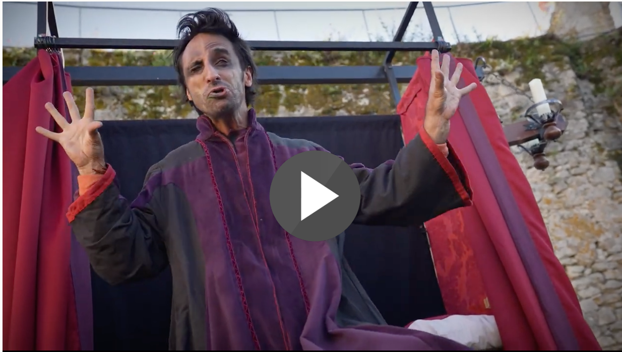
Forteresse de Billy, 2023 Réalisation et montage Maxime Grasset